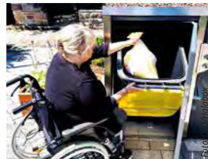
Ein Bügel verhindert hier das Abkippen der Mülltonne. Stattdessen wird sie in einem optimalen Winkel fixiert und bietet so eine komfortable Einwurfhöhe. Davon profitieren insbesondere Personen im Rollstuhl.

(DJD). Es gibt im Haushalt Aufgaben, die niemand wirklich gerne übernimmt. Die Entsorgung des Abfalls gehört für viele Menschen dazu. Durch eine verantwortungsbewusste Müllentsorgung tragen wir dazu bei, Ressourcen zu schonen und die Umwelt zu schützen.