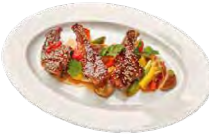
Chili-Honig-Schweinerippchen auf Spitzkohlgemüse lautet eine saisonale Empfehlung.

(DJD). Eine ausgewogene, gesunde Ernährung wird mit zunehmendem Alter immer wichtiger, um möglichst lange fit und gesund zu bleiben. Gleichzeitig spielen der kulinarische Genuss und eine hohe Lebensqualität eine entscheidende Rolle für das Wohlbefinden. Diese beiden Ansprüche klingen zunächst gegensätzlich. Sie zu vereinbaren, ist eine Herausforderung, die der Sternekoch Johann Lafer nun angenommen hat. Aus persönlichen Gründen beschäftigt er sich schon seit einigen Jahren mit der "Medical Cuisine", einer Küche, die die positiven Eigenschaften verwendeter Lebensmittel mit dem guten Geschmack verbindet. Zusammen mit dem fernsehbekannten Ernährungsmediziner Dr. Matthias Riedl hat er dazu auch ein Kochbuch veröffentlicht.