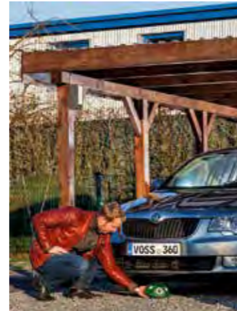
Mit Ultraschall, der für das menschliche Ohr nicht wahrnehmbar ist, lassen sich Marder wirksam vom Auto fernhalten.