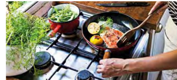
Fisch und Hülsenfrüchte sind besonders gute Arginin-Lieferanten.

Bluthochdruck oder Arteriosklerose ist eine zusätzliche Einnahme von Arginin ratsam“, erklärt die Apothekerin