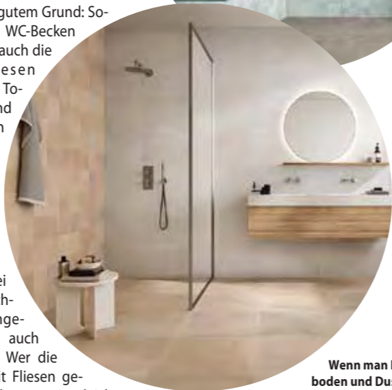
Wenn man Badboden und Dusche durchgängig fliest, wirkt der Raum großzügig und der Durchgang ist komplett barrierefrei.