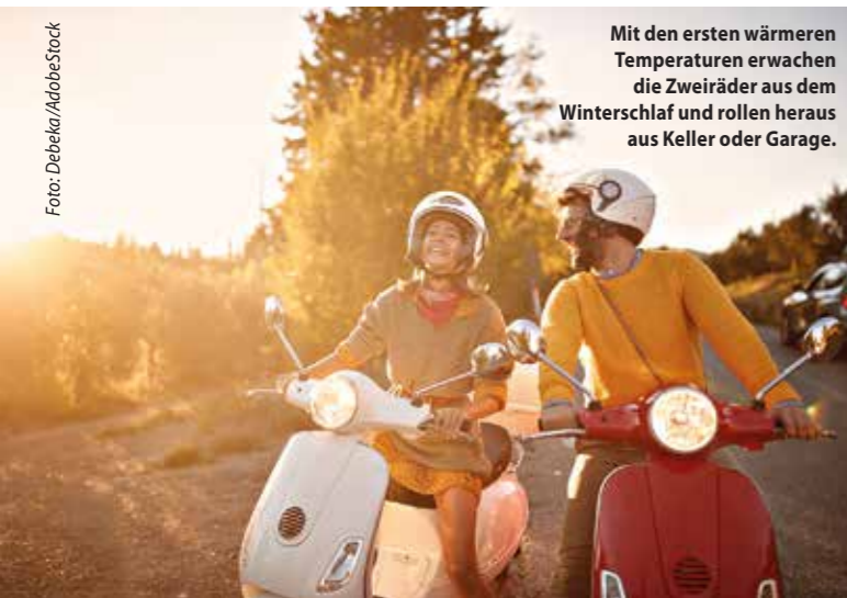
Mit den ersten wärmeren Temperaturen erwachen die Zweiräder aus dem Winterschlaf und rollen heraus aus Keller oder Garage.

Mit den ersten wärmeren Temperaturen erwachen Mofa, Roller, E-Scooter & Co aus dem Winterschlaf und rollen heraus aus Keller oder Garage. Wie man mit den lässigen Flitzern sicher ans Ziel kommt, weiß die Debeka, eine