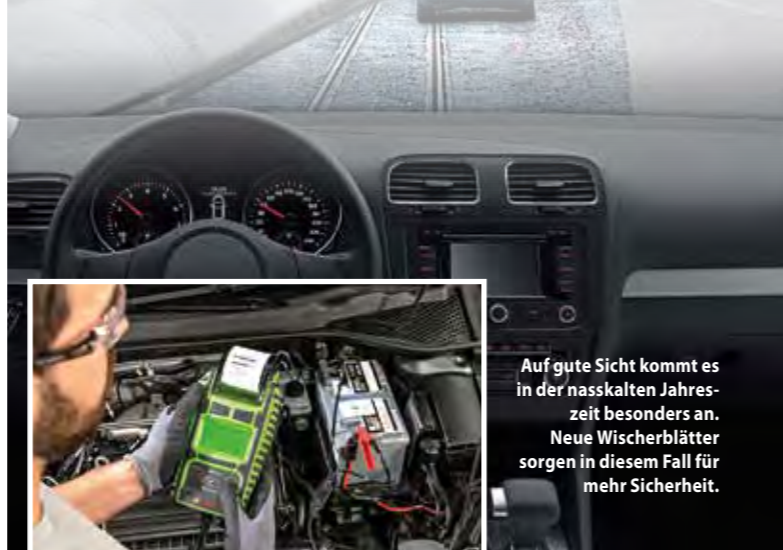
Auf gute Sicht kommt es in der nasskalten Jahreszeit besonders an. Neue Wischerblätter sorgen in diesem Fall für mehr Sicherheit.

für Herbst und Winter ein wichtiges Plus an Sicherheit dar. Adressen von Werkstätten in der Nähe findet man etwa unter www.boschcarservice.com . Zu einer langen Lebensdauer der Starterbatterie trägt zudem die richtige Fahrweise bei: Beim Kaltstart des Motors alle Verbraucher wie Heizung und Radio ausgeschaltet lassen, zum Zünden stets die Kupplung durchtreten.