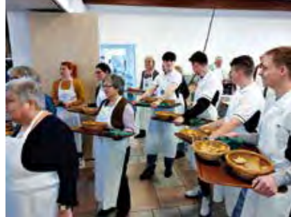
Auch die Auszubildenden der Firma Heller aus Nürtingen unterstützen die Vesperkirche jedes Jahr