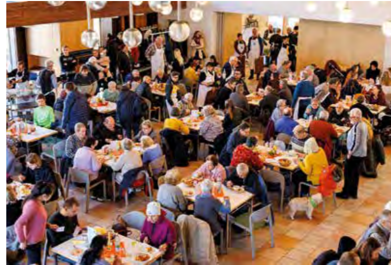
Nach Corona konnten sich die Menschen im letzten Jahr endlich wieder ungezwungen begegnen

Freuen Sie sich wieder auf drei Wochen gelebte Gemeinschaft bei unserer 17. Vesperkirchenzeit!