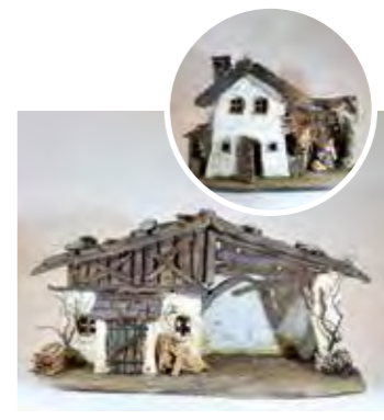
Keramikrippen für innen und außen sorgen für weihnachtliche Atmosphäre