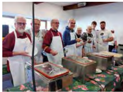
Die vielen helfenden Hände erwarten die hungrigen Gäste

Finanzielle Unterstützung wird benötigt Auch für die Vesperkirche 2024 benötigen wir finanzielle Unterstützung. Mit bereits 30,- Euro finanzieren Sie das Mittagessen für eine dreiköpfige Familie. Daher freuen wir uns besonders, wenn Sie in den kommenden Tagen und Wochen für die Vesperkirche spenden.