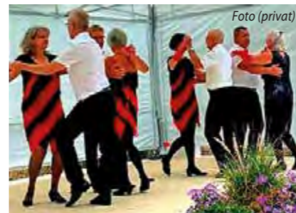
Die Tanzpaare präsentieren den ChaChaCha

Für Paare, die ihre Kenntnisse in den Standard- und Lateintänzen wieder auffrischen wollen und Tanzfiguren üben wollen, die in Vergessenheit geraten sind, starten wir im November wieder mit dem Training. Wir tanzen immer montags von 20-21 Uhr im Großen Saal der Festhalle Frickenhausen international getanzte Schrittfolgen aus den Standard- und Lateintänzen. Im Unterricht legen wir das Augenmerk auf das sportlich/elegante Tanzen. Eintritt ist jederzeit möglich, interessierte Paare können dreimal unverbindlich zu schnuppern. Darüber hinaus bietet der TSV Frickenhausen immer mittwochs ab 19 Uhr die Gelegenheit zum Freien Training im Kleinen Saal der Festhalle im Erich-Scherer-Zentrum in Frickenhausen an. Weitere Infos finden Sie unter www.tsv-frickenhausen.de/tanzen , 07022/44602 oder schreiben Sie uns eine E-Mail unter tanzen@tsv-frickenhausen.de .