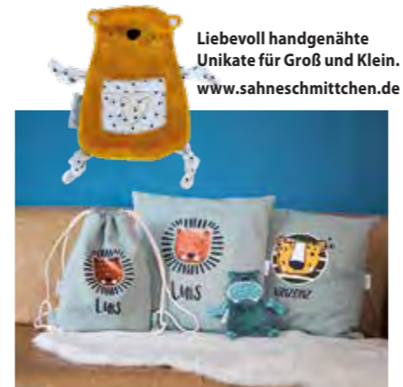
Liebevoll handgenähte Unikate für Groß und Klein. www.sahneschmittchen.de