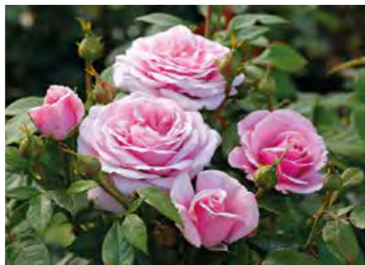
Die „Königin der Blumen“ ist gar nicht so anspruchsvoll, wie viele Gartenfreunde befürchten. Man muss nur ein paar Eigenheiten in der Rosenpflege beachten.

Blühwilligkeit können nachlassen. Unter www.rosen-tantau.com gibt es mehr Informationen zur Pflege und spezielle Schnittweise für verschiedene Rosengruppen.