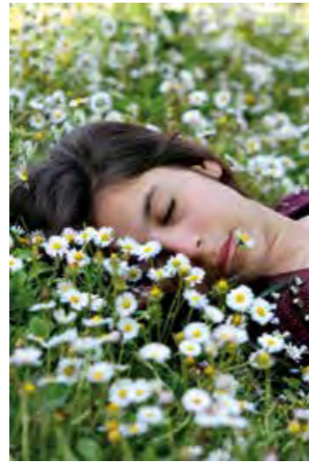
Aroniabeere e.V. Fotograf: Giulia Marotta | Pixabay

Die Leber ist unser größtes Stoffwechselorgan und unermüdlich für uns im Einsatz. Sie verwertet und speichert Nährstoffe, baut diese um und gibt sie zu gegebener Zeit wieder frei.