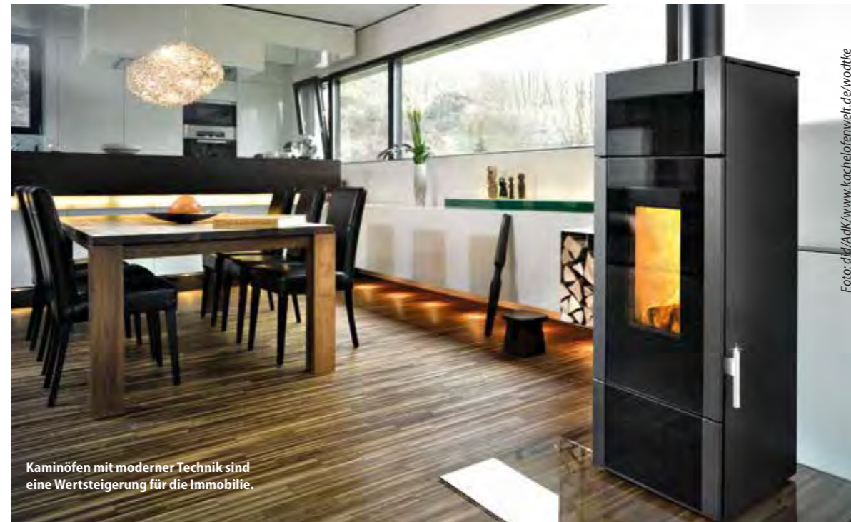
Kaminöfen mit moderner Technik sind eine Wertsteigerung für die Immobilie.