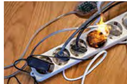
Kurzschluss in Steckerleiste

pm. Die Situation ist brandgefährlich: Angesichts steigender Energiepreise suchen aktuell viele Menschen in Deutschland nach alternativen Heizmethoden. Die Kampagne „Rauchmelder retten Leben“ rechnet deshalb in diesem Winter mit mehr Bränden und warnt dringend vor Heizexperimenten in den eigenen vier Wänden. Wegen der erhöhten Brandgefahr sollten weder Notfeuerstätten, Feuerschalen, Grills oder Teelichtöfen noch alte Heizlüfter, -strahler oder -decken in Wohnräumen zum Einsatz kommen.