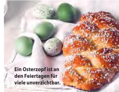
Ein Osterzopf ist an den Feiertagen für viele unverzichtbar.

Berlin, März 2023 – Ostern ist Familienzeit, mit vielen traditionellen Bräuchen. Dazu gehören für viele auch große Festmahle zum Ende der 40-tägigen Fastenzeit, die gemeinsam zelebriert werden. Klassische Ostergebäcke und natürlich das Ei dürfen dabei nicht fehlen. Doch was hat es mit diesen Leckereien auf sich, die zur Osterzeit bei jedem Deutschen Innungsbäcker zu finden sind?