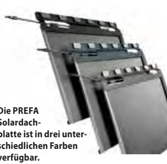
Die PREFA Solardachplatte ist in drei unterschiedlichen Farben verfügbar.